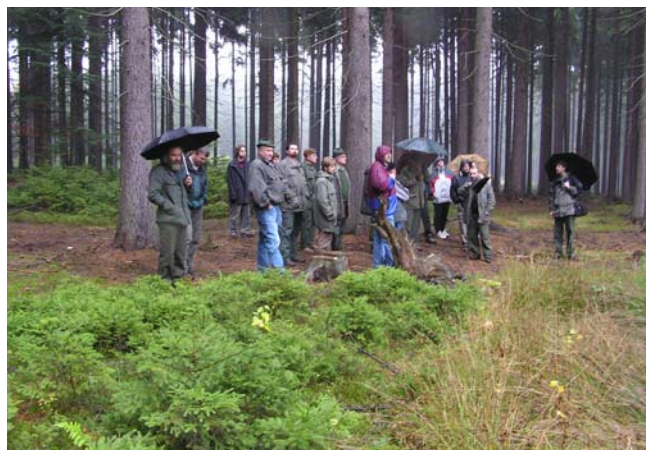
Exkurze na certifikované lesní majetky u Svitav, 5.11.2004