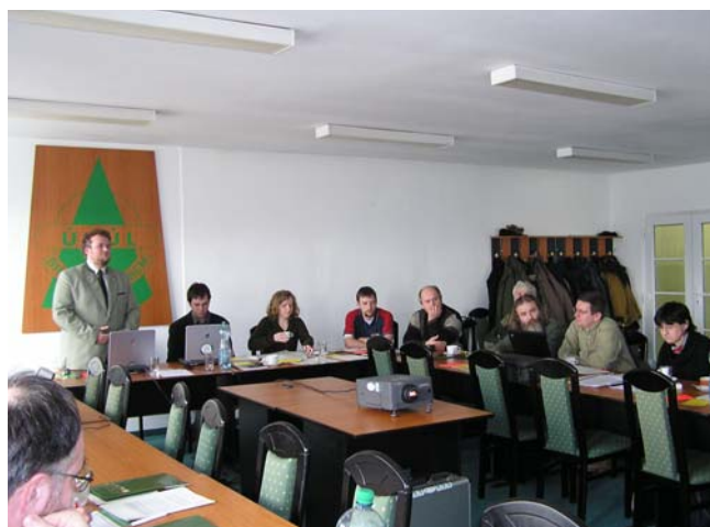
4. valná hromada FSC ČR, foto: Jitka Schneiderová