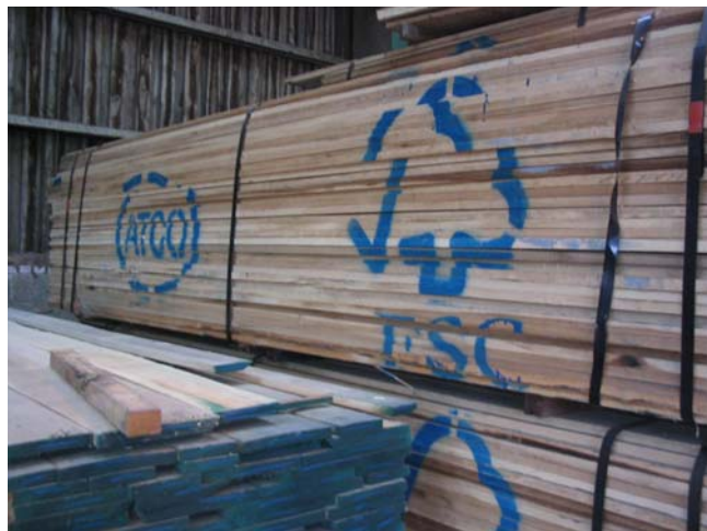
Ilustrační foto, FSC A.C.