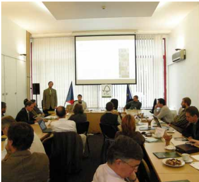
Valná hromada FSC ČR, září 2008