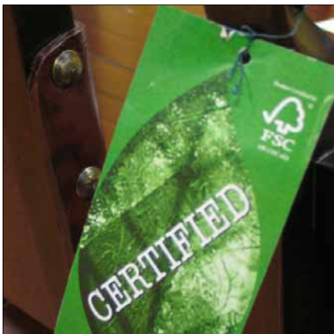
Ilustrační foto, Juraj Vysoký

Princípy a kritériá sú jedným zo základných dokumentov FSC, v ktorom je zadefinovaná filozofia dobrého obhospodarovania lesov.