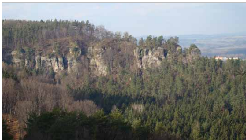
Ilustrační foto, Juraj Tužinský

Lesy České republiky, s. p. získaly první prestižní certifikát ekologicky a sociálně šetrného lesního hospodaření pro lesní hospodářský celek Žehrov, který je součástí lesní správy Nymburk. Lesní hospodářský celek Žehrov se rozkládá na ploše 2765 ha, částečně v chráněné krajinné oblasti Český ráj. Převažují borové porosty, větší podíl má ještě smrk a dub.