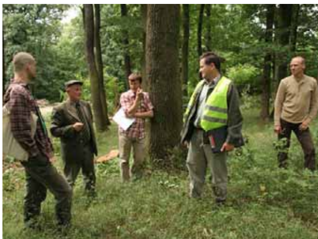
Ilustrační foto, Juraj Vysoký

V poslednom období na Slovensku výrazne vzrástol záujem o FSC certifikáciu lesov, najmä medzi neštátnymi lesnými subjektmi. Súvisí to najmä s tým, že ak sa vlastníci a užívatelia lesov uchádzajú o finančný príspevok v rámci lesníckych opatrení z Programu rozvoja vidieka SR na roky 2007–2013, pri vyhodnocovaní žiadostí získajú plusové body, ak hospodária v certifikovaných lesoch.