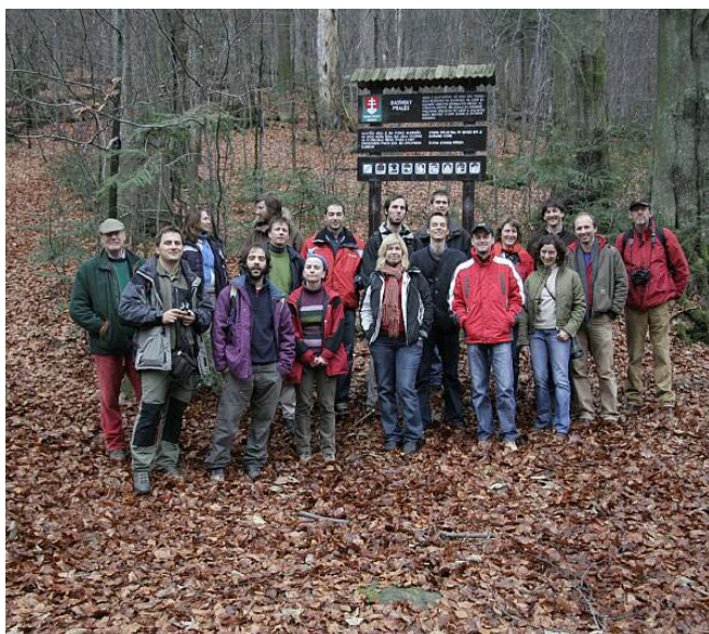
Foto: Stretnutie európskych národných iniciatív FSC.