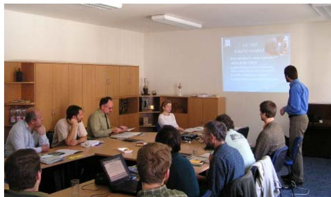
Foto: Jednání valné hromady FSC ČR, o. s.